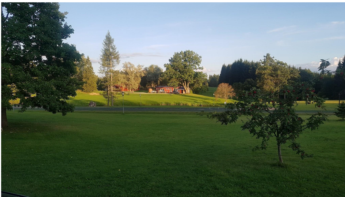
Vaade Madsa maastikule ja spordirajatistele.