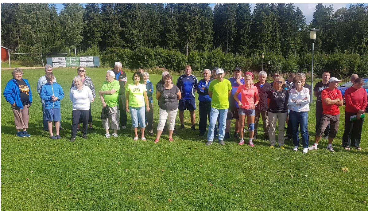
24. august 2019 V Madsa mängude avamine