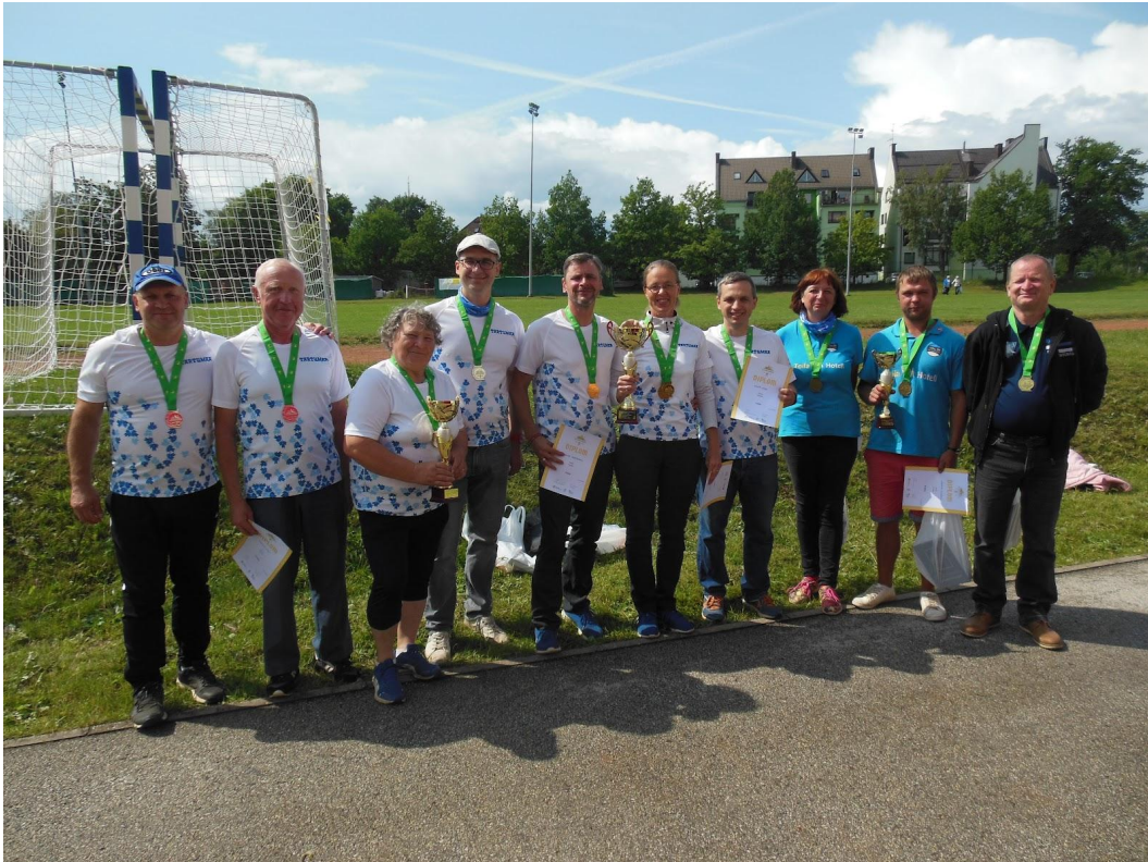
Tartu SVK petangimängijad võitsid Tartu valla I ja II võistkonnana Eestimaa suvemängudelt 39 võistkonna seas 1. ja 2. koha. Toila vald tuli kolmandaks.