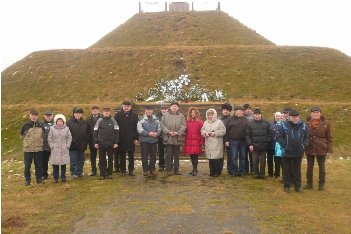
J. Kuperjanovi ausamba ja Paju mõisa ekskursioon 17.02.2017. Pärast seda Bowlinguturniir EV 99. aastapäeva tähistamiseks Valgas.