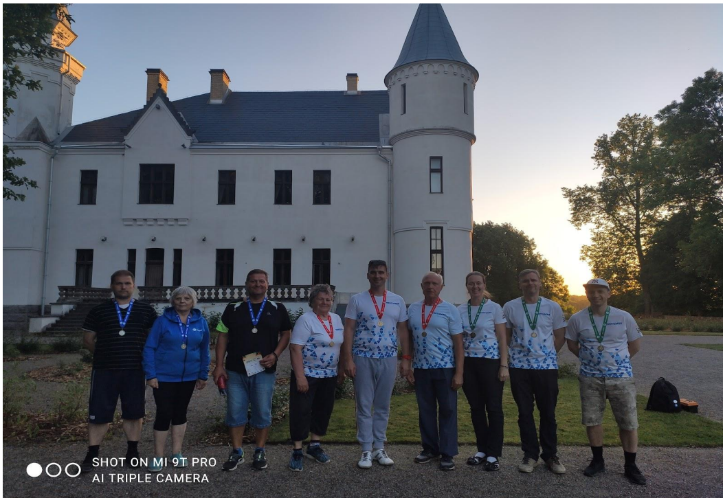
Imelise Alatsikivi lossi juures toimuvad Tartumaa suvemängud on muutunud oodatuks ja meeldejäävaks sündmuseks. Pildil on 2021. aastal medalile tulnud Tartumaa petangimängijad.