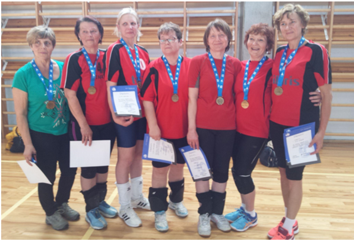
EMV 2018 N55+ kuldne naiskond