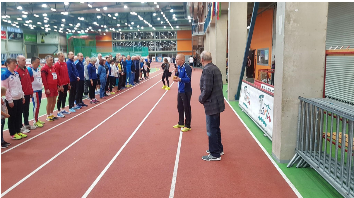
14.12.2019 Kevek lahtiste sisekergejõustiku meistrivõistluste avadefilee TÜ spordihallis