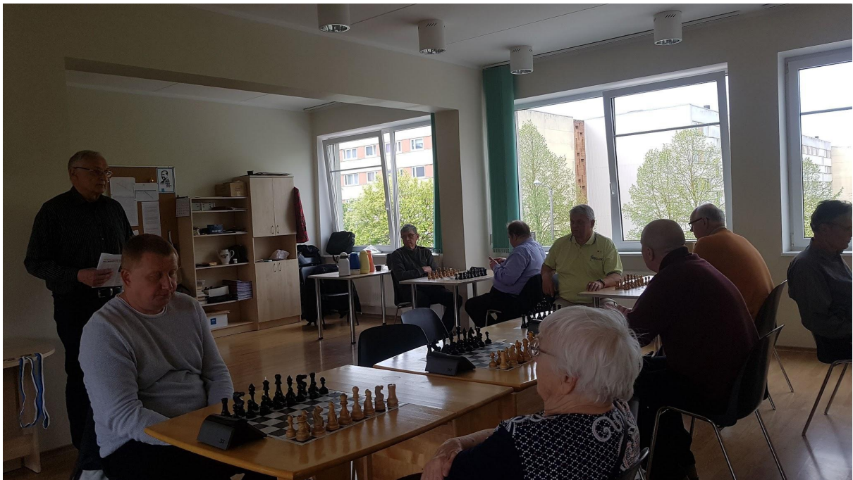
Kalda Päevakeskuse maleturniir 2019