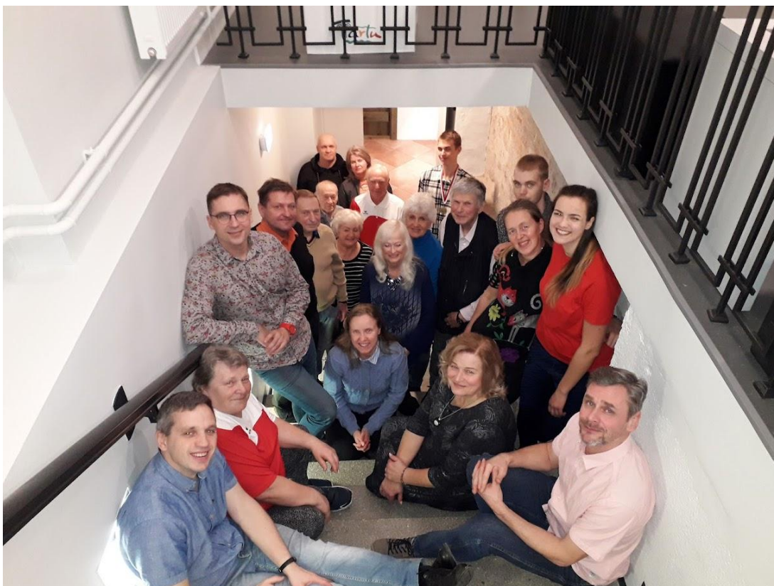
Petangihooaja lõpetamine 5. novembril 2021 Eesti Spordi- ja Olümpiamuuseumis