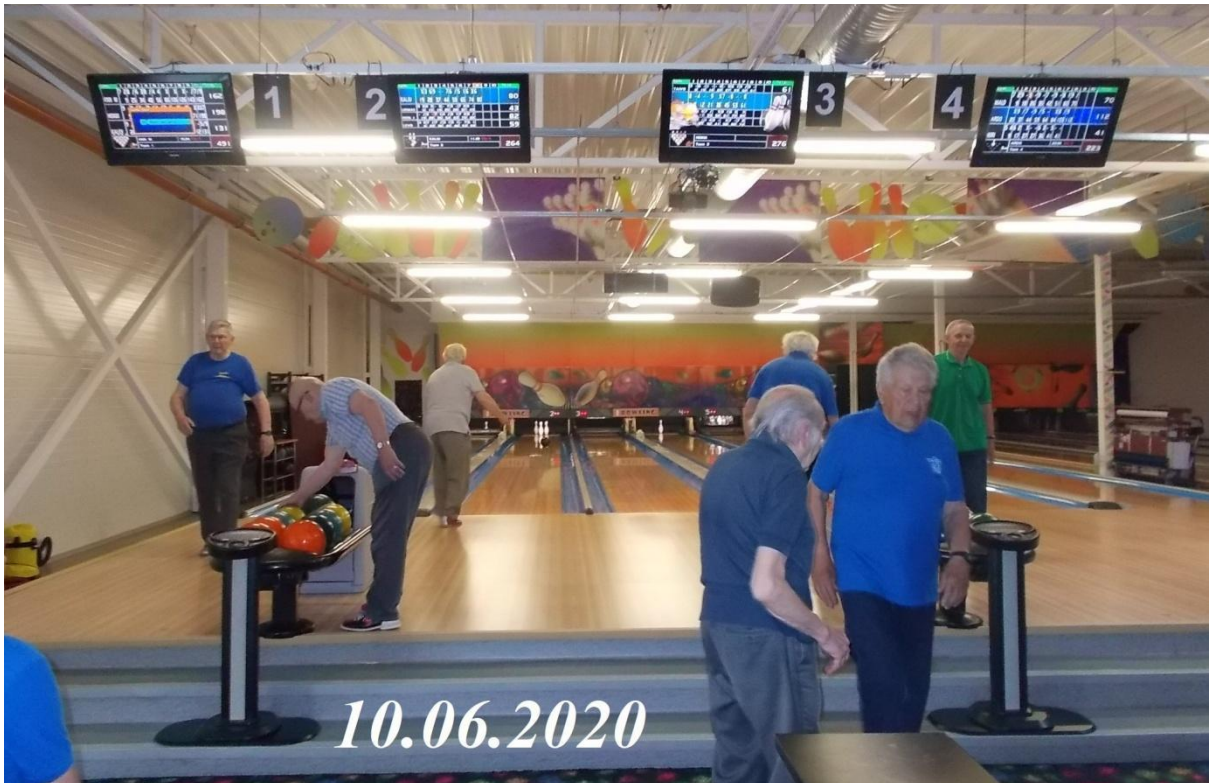
Vaheaega pandemipuhangute vahel sai ära kasutada. Kui varasematel aastatel sai suvel mängudega vahet peetud, siis nüüd seda ei tehtud.