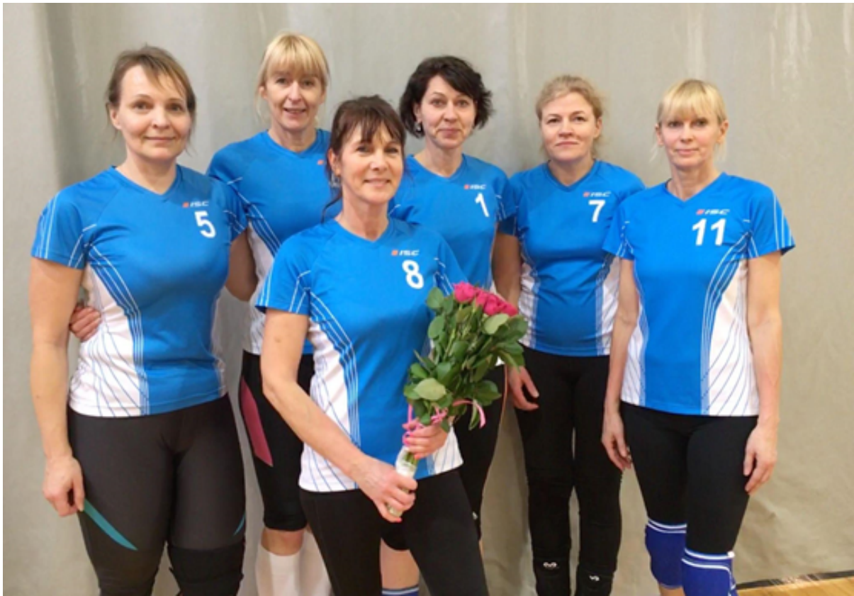
EMV 2019 N50+ I koht