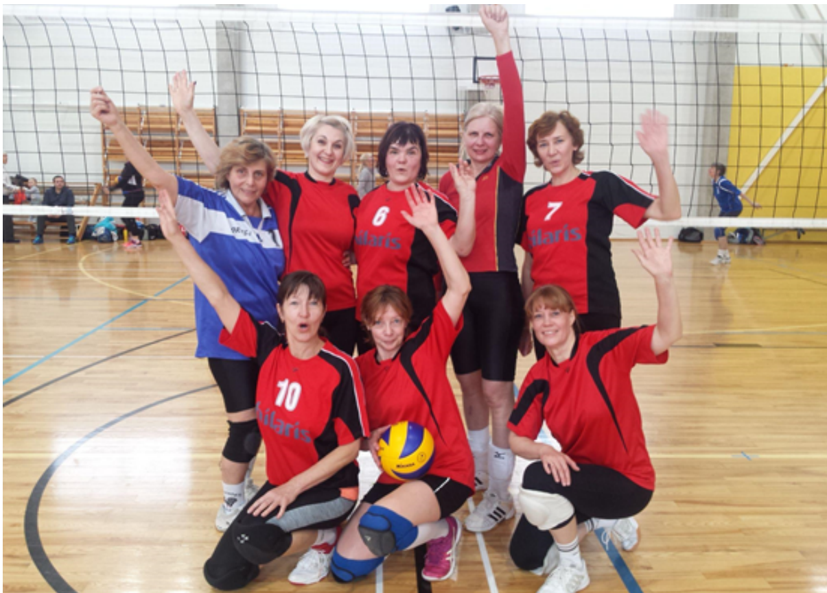
EMV 2018 N50+ I koht võidukas naiskond