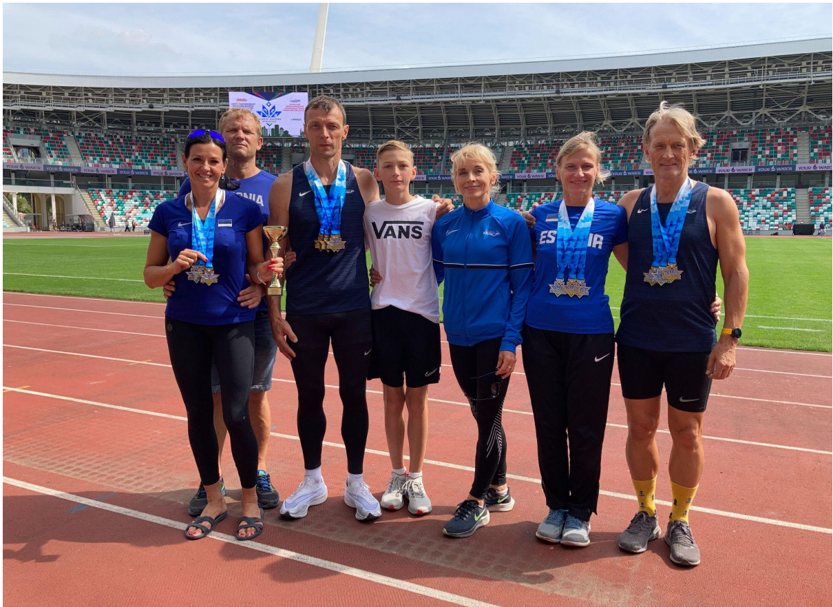
Tartu SVK liikmed Valgevene MV suvel 2021