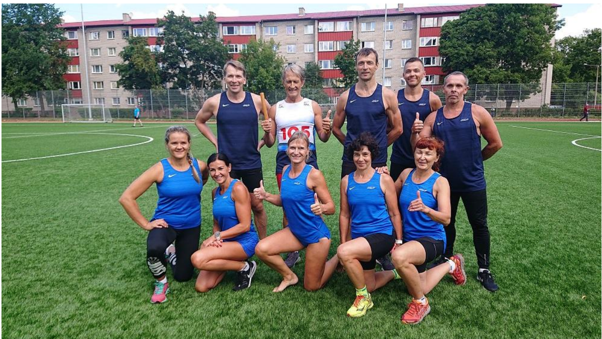
Narvas toimunud ESL spordimängude võidukas pendelteatejooksu võistkond 2021