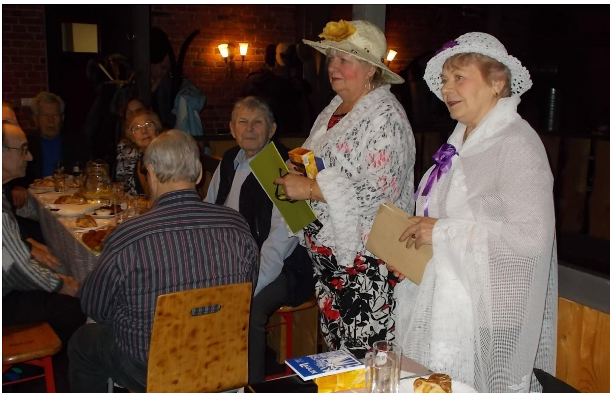
2019.a kokkuvõtete tegemine Sõbra keskuse Pesas (dets. 2019)