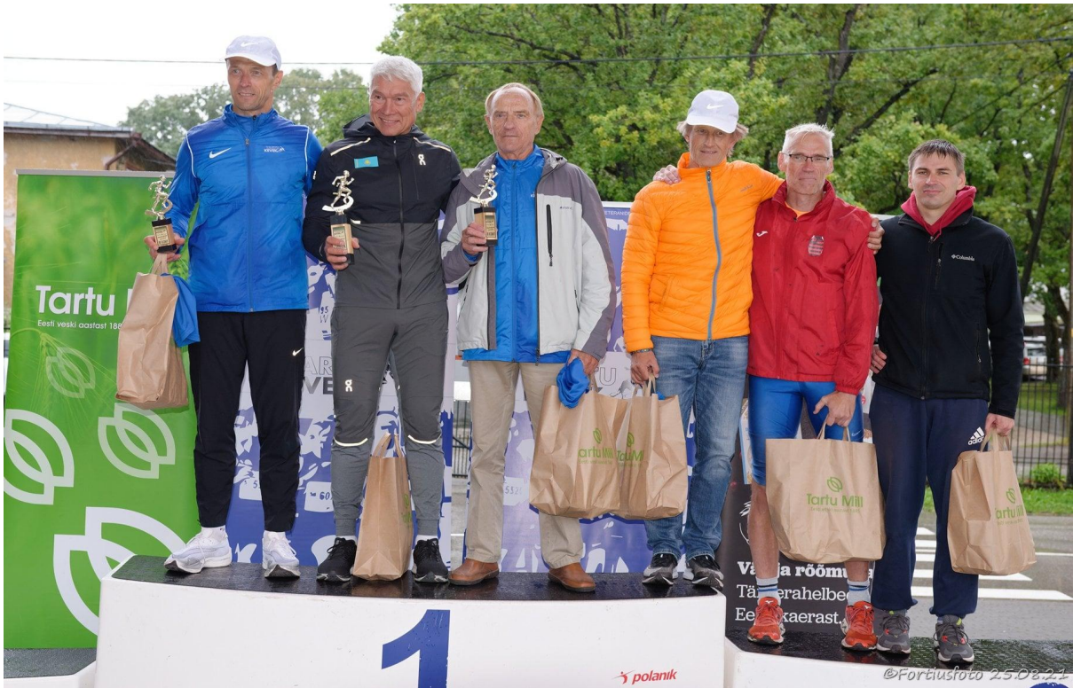
Neli kiiret Tartu SVK sportlast Staadionijooksusarja 2021 autasustamisel